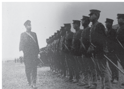
図1 陸軍士官学校の点呼

または、士官学校の射撃・馬術訓練の場面を詩の言葉で浮き彫りにして いた。例えば、「点火時の前」と題する詩作は、「空の上一直線に行く音は 何だ！あれはMG、彼自身を驚かす物すごい物音 灌木の小枝、馬場を