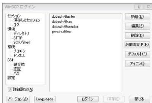
図3：保存されたセッション

またよりセキュリティの高い公開鍵認証でログインする場合は、パスワードの代わりに秘密鍵の欄に秘密鍵のある場所を指定します。秘密鍵を使うためにはPuTTYgenなどで事前に秘密鍵と公開鍵を作成して接続先のサーバ上に公開鍵を登録しておく必要があります[2][3]。