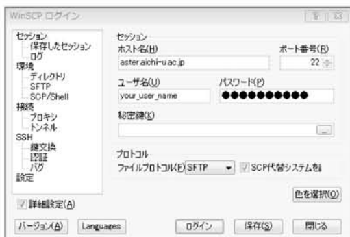
図2：セッションの設定画面

WinSCPを使うためには、ホスト名、ポート番号、ユーザ名、パスワードを設定する必要があります。これらを設定する