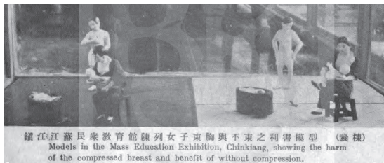
图3 《镇江江苏民众教育馆陈列女子束胸与不束之利害模型》 55

为强调束胸的危害，许多作者特拿束胸与缠足相比，称束胸“与缠足的恶习有何分别呢” 50 ？更有甚者，为使读者认识到束胸之害，1929年禁绝束胸的政令称“其危害实倍于缠足束腰” 51 。1928年有人认为：“自在欧风东渐以后，我们女子稍有点学识的，谁也都知道要解放了，但是解放应当从身体上做起。……束胸其有害身体的发育，比缠足还大。” 52 又称“而不知还有较缠足之为害尤大者，束胸是也。偶见报纸之卫生栏内载有一二篇，未见有人竭力申说。故草此一篇，以告妇女界，幸注意焉” 53 。《晨报副刊》甚至有作者刊文表示“若束胸毋宁缠足”，并进一步解释说“我不是赞成裹脚的……但是缠足不过缠四肢之足部，与人生关系，不及束胸之大” 54 。