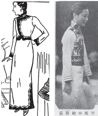
图15 《旗袍与小马甲》（左图）

束胸女性本身也在寻求“天乳运动”下着装的新出路。1929年，有报道称虽然解放束胸的声势日渐增长，沪大女生思想上赞同解放号召，但又碍于现实仍然保守的风气，使普通女学生产生“既不能束胸。又不能不束”的为难，1931级的几位女同学索性发明了一种穿在普通旗袍外面的马甲，制法与普通的相同。不同之处在于不扣前面纽扣：“两面的襟沿让共开在胸前，恰把隆起的两方按着尺寸的覆盖着，很像西式女子的外衣，短一点和缺两只袖子就是了。这么一来，就能把束胸不束胸的问题解决。” 129 此举受到了沪大女生们的欢迎，“大家都照那样子叫裁缝去做了” 130 。这一旗袍外穿小马甲的发明一经问世，便受到了上海女性的欢迎，1930年《申报》刊载广告称“上海女界，现盛行旗袍小马甲” 131 ，并以四元一件的价格售卖这一新式旗袍外穿马甲的成衣，同年《中国大观图画年鉴》所收录的照片印证了这一点（图15）。1933年的《玲珑》杂志也刊登了这种旗袍外套小马甲的时装图片（图16）。