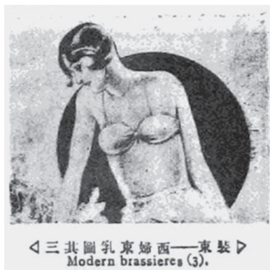
图8 《装束——西妇束乳图其三》 83

1927年《北洋画报》于第114期、第115期和第117期连续三期刊载介绍了当时西方流行的女性胸罩款式，并将其翻译为“束乳”，英文标题 Modern brassieres，即现代胸罩。照片上的西方女性短发烫发呈 Flapper 风格，此风格当时正在西方流行，女性多穿着缩胸胸罩塑造平坦上围，并不刻意突出胸部。