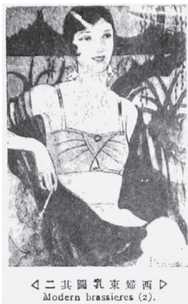
图7 《西妇束乳图其二》 82