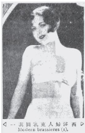
图6 《西洋妇女束乳图其一》 81