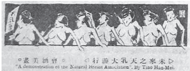
图14 《未来之天乳大游行》

《北洋画报》刊载了名为《天乳运动》的评论，在赞同放胸的同时也提出了“蓄发的砍头”，是武汉剪发运动的现象，‘剪发的重罚’是北方反剪发的手段，不知这天乳运动，也得借武力为后援否” 100 的质疑。