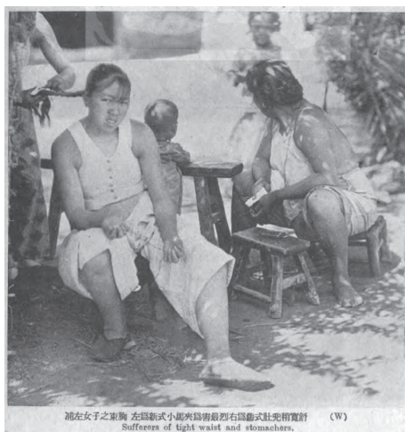
图1 《浦左女子之束胸：左为新式小马夹为害最烈右为售式肚兜稍宽舒》 48