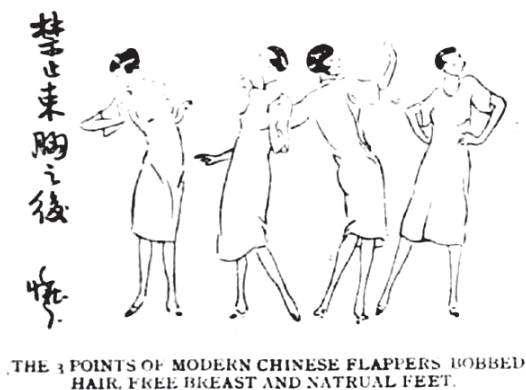
图12 《禁止束胸之后》 92

国传统审美要求，得到了“天乳运动”中一些寻求避免显露胸部曲线解决之道的保守改良人士认可。1928年有人谈及解放束胸后女子外衣改良，认为当时女性外衣紧小是导致束胸行为愈演愈烈的主要原因，提出调和中国古今外衣的八字形和葫芦形，取其折衷“而成曰字形”，“自其前后身观之，则大部分成有规则之长方形。于腰间或束带，或略有变化，则成日字形。此形式之衣装，为西人最近之新式样，亦正可为我人法。” 91 其中所描述的“西人最近之新式样”便是“flapper”着装风格。作者观念较为保守，认为天足女子“十趾如钉钯，虽言滑稽，实不美观”，放胸女子“两乳胡松，颠摆于胸前，则有类于母蓄，更非尽善”，主张使用内衣和外衣来掩饰胸部曲线，在西方代表叛逆反传统的“flapper”风格因其不强调曲线的外表，意外被一些持中国传统保守审美，反对显露身体曲线的国人所接受。