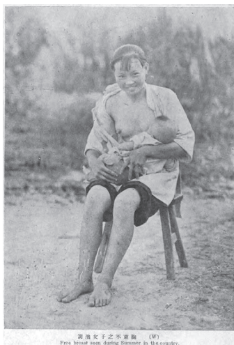
图2 《柳滨女子之不束胸》 49