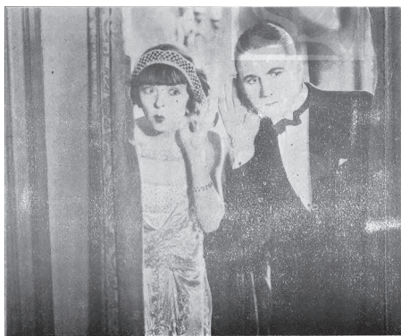
图9 《中华影片公司经理之新片西文名 PERFECT FLAPPER》 84

近代中国电影行业的诞生发展，也促进了“flapper”风格在中国城市的传播。1928年的《申报》刊载了“大世界露天影戏场”上映美国女演员珂玲·摩亚《风流美人》的电影广告，称之为“美国第一国家影片公司最新出品，世界唯一著名浪漫滑稽佳片，女明星珂玲摩亚杰作” 85 ，并附上了该片英文译名“The Perfect Flapper”。这是一部展现“flapper”群体生活状态的爱情喜剧，剧中人物的着装和生活方式是典型的“flapper”风格，也是珂玲·摩亚所拍摄的第二部“Flapper Film”，于1924年在美国上映。据1926年国内电影刊物的宣传，本片在1926年时便由中华影片公司引进国内 86 （图9），1927年还有杂志报道了主演女明星的个人专题小传，并将本片作为其代表作刊载了剧照 87 （图10），这部“flapper”风格的影片连映两年仍然享有话题可见其受欢迎程度。