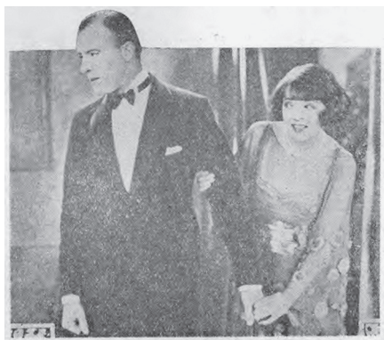
图10 《Colleen Moore 主演 “The Perfect Flapper” 的一幕》 88