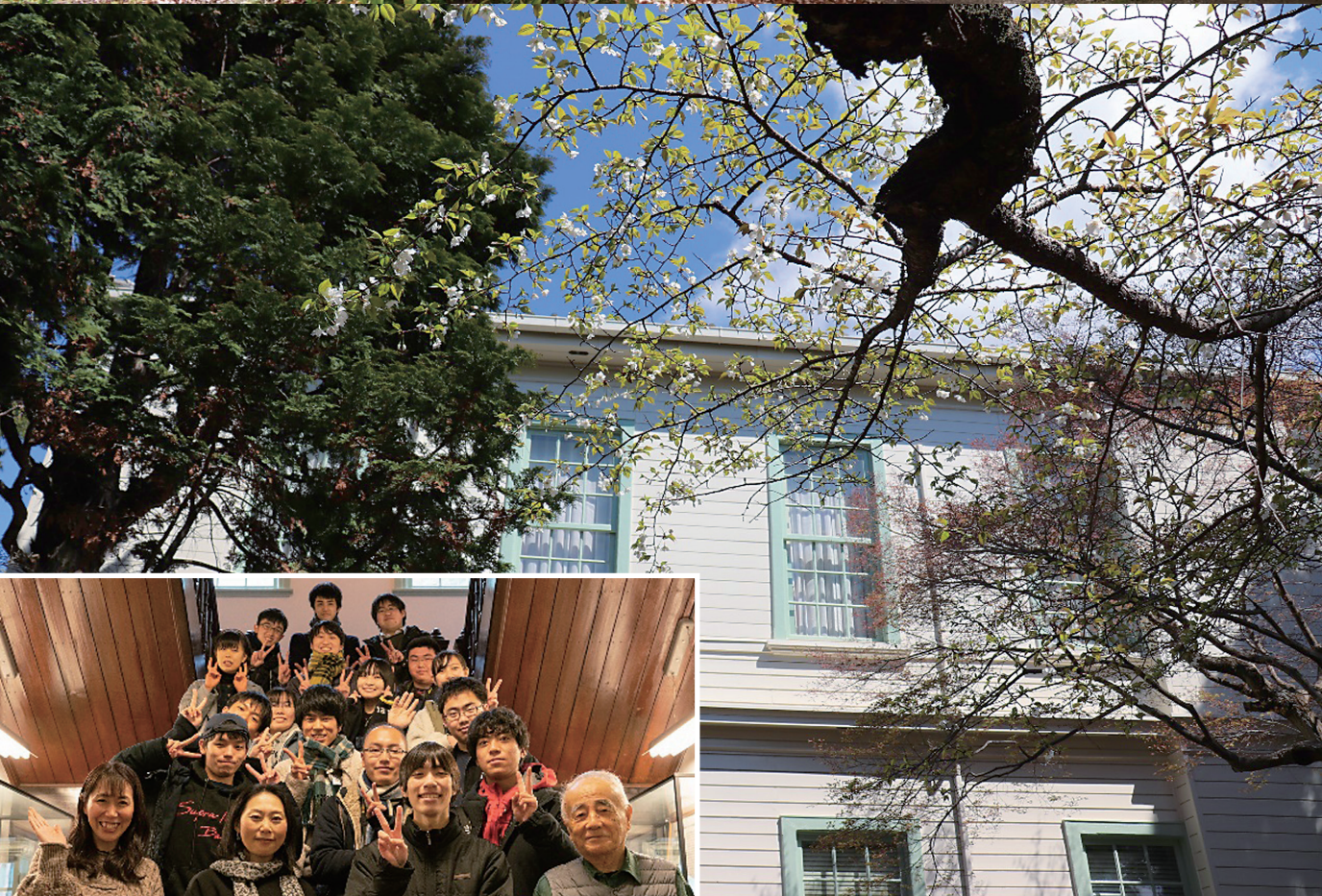
ご協力いただいた 写真部員 & 東亜同文書院大学記念センタースタッフ