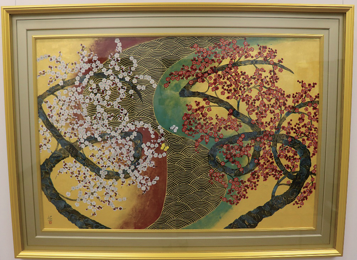
愛知大学名誉博士・平松礼二画伯特別展示室 「平松礼二 紅白梅」