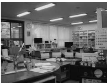
ランゲージセンター