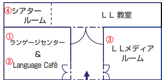
ランゲージセンター平面図

外国語に関する本や雑誌、検定試験の対策本、さまざまな言語のDVDなどがたくさんあります。本や雑誌は2冊、2週間借りることができます。DVDはLLメディアルームで視聴することができます。どちらも学生証があれば手続きできます。冬休み、春休みに検定試験勉強をする学生のみなさんにはおすすめです。