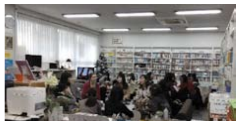
2019 English Cafe

今学期は English Café のみを月・水・木・金にオンライン (Zoom) で開催しています。参加する場合は、 tgoken@ml.aichi-u.ac.jp まで参加希望日をメールしてください。詳細は語学教育研究室のホームページで案内しています。