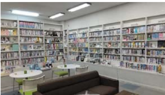
ランゲージセンター