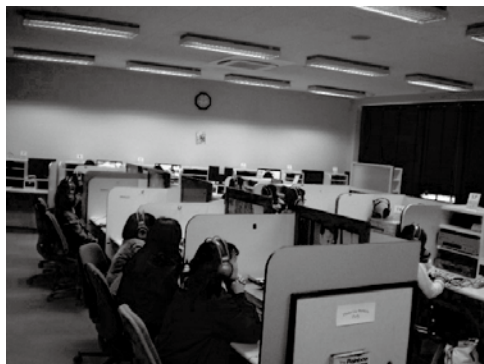
LL メディアルーム 個別ブース

e-ラーニングやレポートの作成などにも利用できます。現在は感染対策のため、1つおきに視聴ブースを使用しています。また個人のイヤホンやヘッドホンを持ってくると、より安心して使用できます。