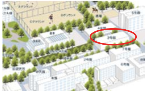
豊橋校舎 見取り図