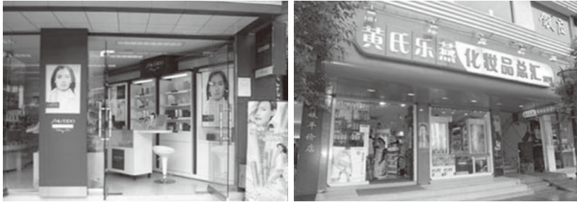
写真1 中国の化粧品専門店

方都市での市場開拓の主役にする戦略を打ち出すとともに「魅力連盟」という契約により専門店販売網づくりをスタート。2010年6月にはこれを見直し他にメイベリン、羽西、ガルニエ、ミニナースも取り扱いブランドとして追加しマルチブランド戦略によって地方都市の専門店攻略戦略を積極的に展開している（謝 2011d）。