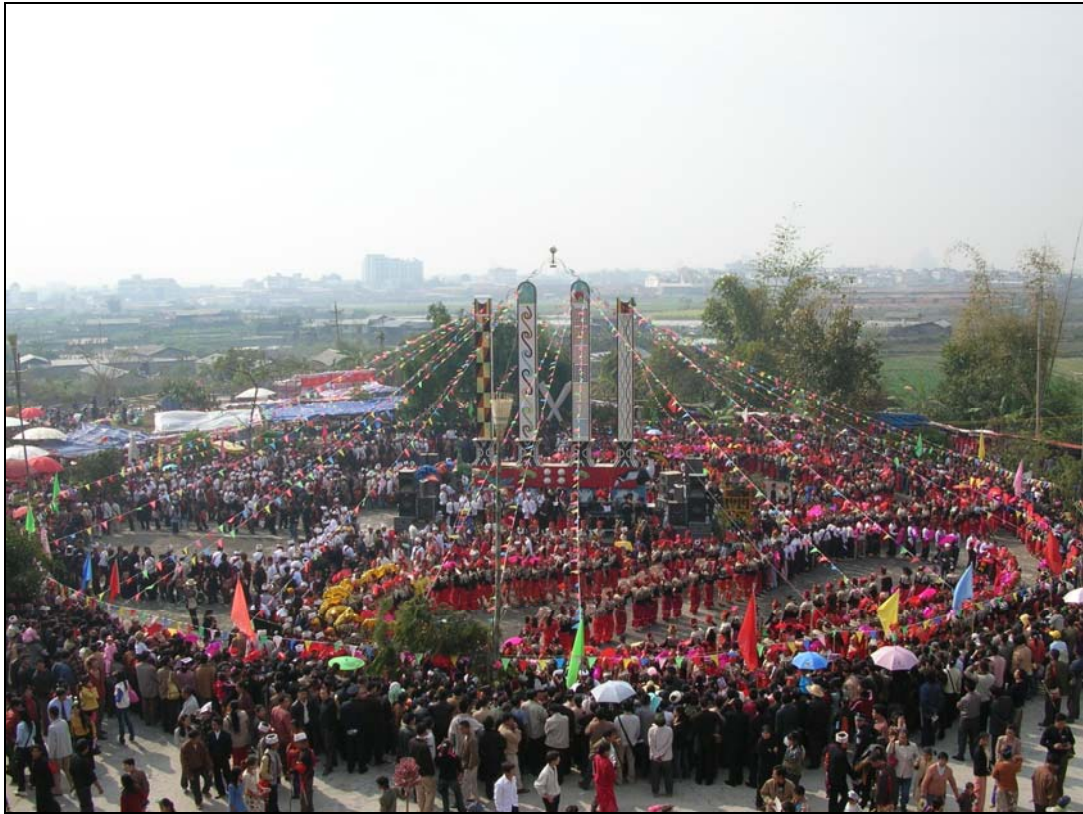
2013年德宏州陇川县朋生村“目瑙纵歌”节日现场（笔者摄）