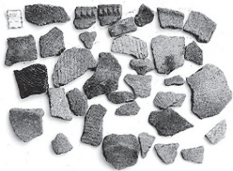
1 トレンチ10区出土 土No.363 弥生土器の破片

なお、河原田遺跡の遺物は、当初は他の遺跡の遺物との混在はないと想定していたが、宮西遺跡（田原市大久保町）の土器2点が混ざっていたことが分かった。弥生土器の破片の一部に横山将三郎氏が使用していた赤い接着剤のようなものが付着していたため、横山氏が発掘した宮西遺跡の実測図と照合したところ、行方不明だった壺であることが判明した。