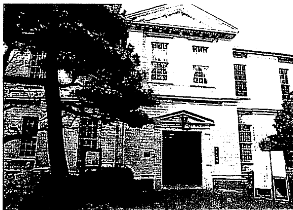
外壁改装後の大学記念館