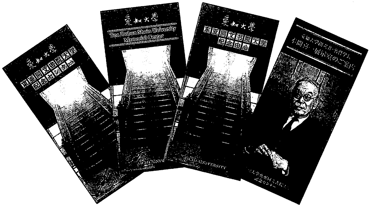
パンフレット（日本語）（英語）（中国語）（本間展示室パンフ）