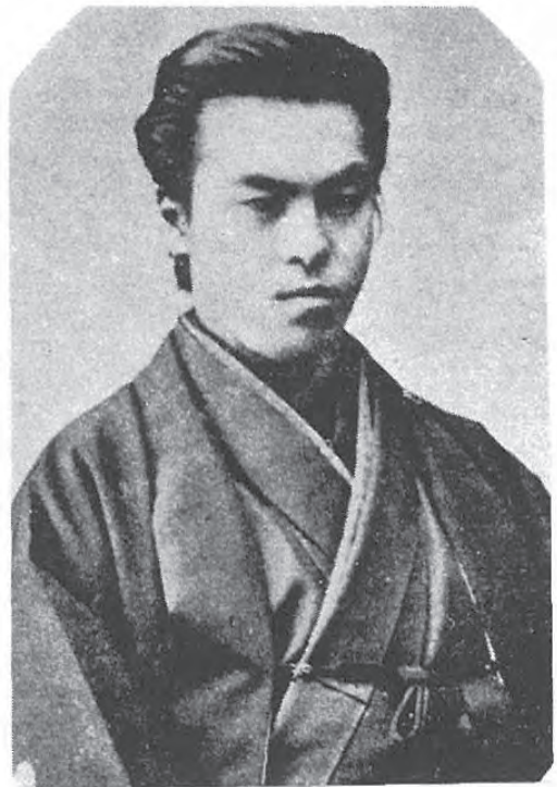
写2 青年時代 明治16年頃 (注1より引用)

なお、この独学を裏付ける史資料に、1879年(明治12年)の17歳から約10年間にわたって書き留められた『蛭雪余聞』 7 がある。これは人からの聞き書きや書物、雑誌、観察などからの幅広い情報に関心のままに書き綴った記録である。後半にはオーストリア・ドイツでの海外留学期間も含まれており、篤麿の関心事を知る上で大変興味深い。とくに、注目されるのは、その幅広い関心領域である。洋の東西を問わず、倫理から歴史、地理、地名、社会、階層、政治、法律、交通、政治、税制、貿易、貿易品、人物、生物、家畜、食物、農業、牧畜、水産業、工業、職人、商業、物理、数学、科学、人体、人種、医学、美術、文化、風俗、逸話、迷信、賭博、軍事、ヨーロッパの諸事情、生産力、生物淘汰、学術競争など、その好奇心の広がりには驚くほどである。西洋文化が入ってくるこの時代、あら