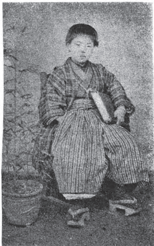
写1 幼年時代 明治6年頃 (注1より引用)

篤磨は前述したように1863年(文久3年)に京都で生まれた。そして1872年(明治5年)、京都の銅駝小学校へ入学している。しか