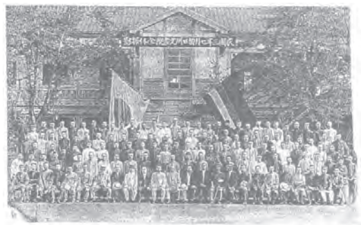
写 5 1914 年の東京同文書院・全学生写真 (注 34 より)

その一例が優れた教師陣を用意したことであった。その教師陣は日本でもトップレベルにあった 34 。たとえば、日語辞典類を出版し、留学生用の語学教育の第一人者の金井保三、『広辞苑』編集の新村出、日本中学校校長で昭和天皇の皇太子時代に進講したことのある猪狩又蔵、中央大学の前身である英吉利法律学校で有名になった杉村広太郎、名著『化学本論』で知られる片山正夫、熱田と檀原両神社の宮司をつとめた神主の副島知一、英文学者の前田元敏、孫文を支援した宮崎滔天の兄で孫文と親交のあった宮崎寅蔵、東京美術学校教授になる小林萬吾、国語学の大家である亀田次郎、そしてこよなく東京同文書院と留学生を愛し、世話した柏原文太郎夫など、まさにキラ星のごとき教師陣であった。