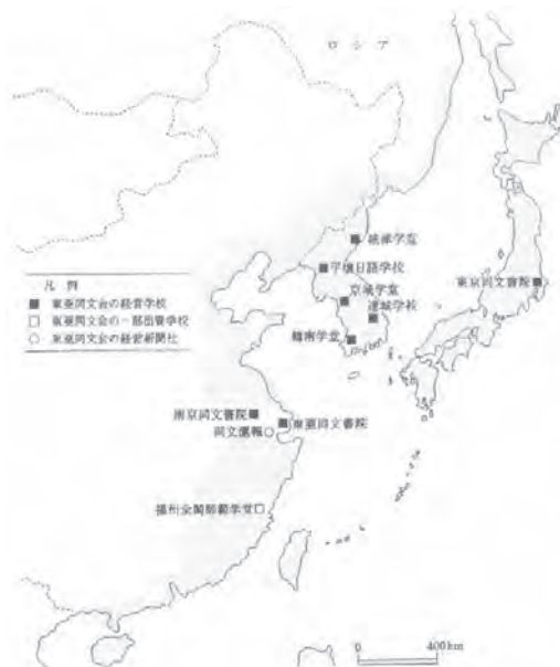
図4 東亜同文会が直接または一部経営した学校と新聞社 (1906年) (『東亜同文会報告』1906年より作成、藤田原図)