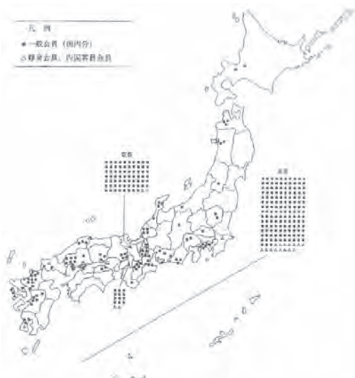
図2 東亜同文会会員の都道府県別分布 (1902年12月) (『東亜同文会報告』第38回より作成、藤田原図)

藩閥政治嫌いが影響していたためか、元薩長土肥の藩の各県は目立たない。また同年における外地の都市別会員の分布を見ると朝鮮に多く、うち釜山、仁川、漢城（のち京城）、木浦などの都市に集中している。清国では上海、北京、天津、漢口、広東、福州に広がっている（図3）。そのほとんどは日本人であるが、朝鮮人は9人、清国人は26人を数え、そのほかペルシャ人が30人、トルコ人2人で、