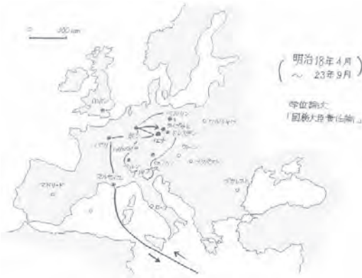
図1 ヨーロッパ留学コース (注1より作成)