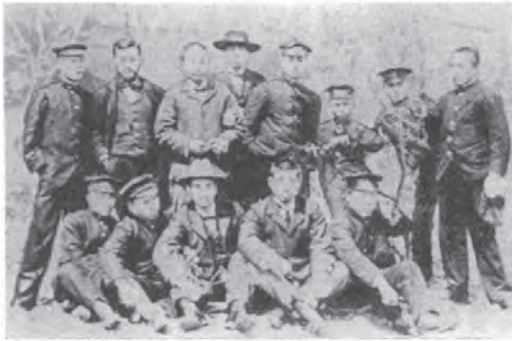
写6 南京同文書院の学生たち (明治33年) (注39より)

根津一が初代同委員長に就任し、1900年(明治33年)5月12日、現地での南京同文書院としての開院式が行われた。