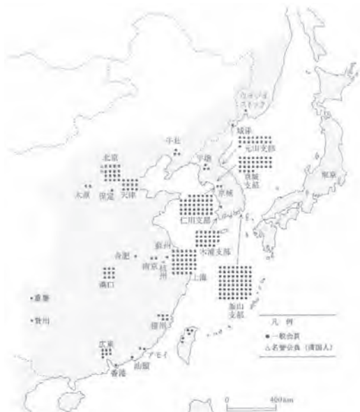
図3 外地における東亜同文会会員の都市別分布 (1902年12月)

藩閥政治嫌いが影響していたためか、元薩長土肥の藩の各県は目立たない。また同年における外地の都市別会員の分布を見ると朝鮮に多く、うち釜山、仁川、漢城（のち京城）、木浦などの都市に集中している。清国では上海、北京、天津、漢口、広東、福州に広がっている（図3）。そのほとんどは日本人であるが、朝鮮人は9人、清国人は26人を数え、そのほかペルシャ人が30人、トルコ人2人で、