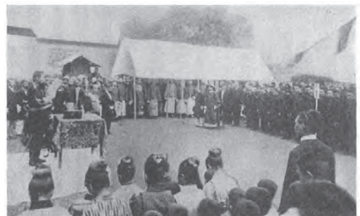
写7 東亜同文書院開院式・桂墅里校舎 (明治34年5月26日) (注39より)

こうして1901年(明治34年)4月30日、第1回の入学式が東京の華族会館で行われた。篤麿はそこで東亜同文書院設立の趣旨とともに学生の心構えについて、学問を中途半端にするような意思の弱さのないように、また、日本人としての名誉を失わないように、そして客気に走って無謀な行いをしないように、最後に衛生に注意し、身体を害することのないように、などの点について訓示をした 41 。そこには学習院の生徒に対してと同様な学生を思う気持ちが述べられている。篤麿にとって、南京同文書院の轍を踏まず、清国での本格的ないわば国際的な日本人教育への大きな