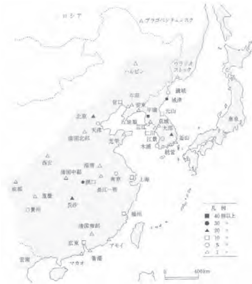
図5 5~75回の短報発信地の発信回数別分布(1900~1906)『東亜同文会報告』5~75回より作成

ネットワークを形成していたことがわかる。この中には教育情報も多い 26 。但し、この時期上海情報は漢口や長沙に及んでおらず、清国の中の主流ではなかったこともわかる。