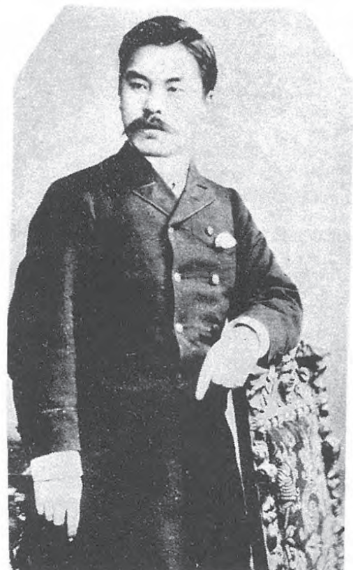
写3 ドイツ留学時代 明治21年5月 ライプチヒにて