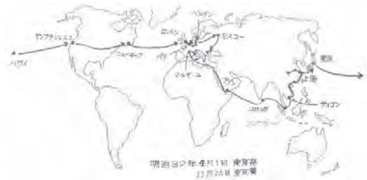
図6 2回目の世界旅行コース(注1より作成)

こうして、学習院の思いを残しながら、1899年(明治32年)4月1日、横浜港からアメリカ船コブチック号でハワイ経由のサンフランシスコへ向かった。図6にそのコース