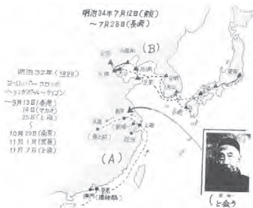
図7 近衛篤麿の巡検踏査地とコース(藤田原図) (A)は図6の帰路(B)は北清旅行のコースを示す

による甘言でなく、清国の盛衰は日本に密接な関係がある」と説くと、総督は喜び、日清同盟論的な言葉も発したという 28 。